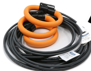
Anpassade Rogowskispolar till EMS96