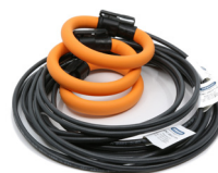
Anpassade Rogowskispolar till EMS96 (1-4000A)

Till EMS96 finns också anpassade Rogowskispolar med Plug and Play-funktion. Spolarna klarar strömmätning mellan 1A till 4000A. Se separat produktblad för spolarna.